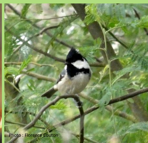
La Mésange nonnette

https://fr.wikipedia.org/wiki/M%C3%A9sange_nonnette