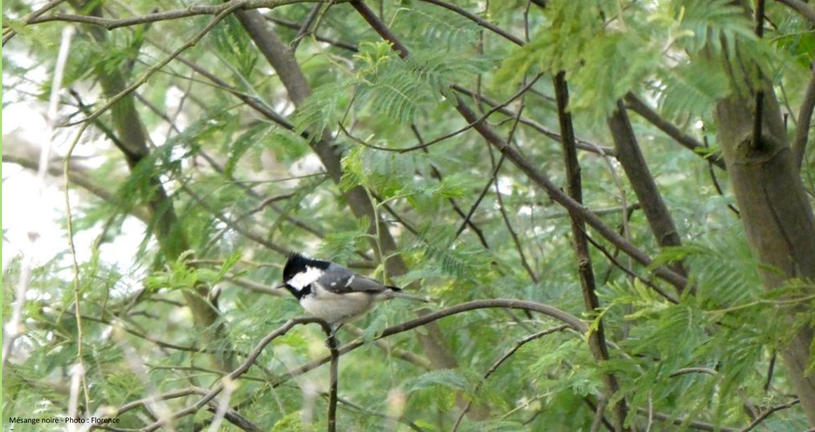
Mésange noire