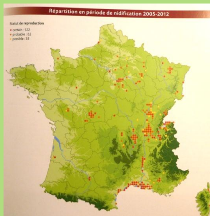
Zones de nidification de la Nette rousse en France.

« La Nette rousse est l'un des canards nicheurs les plus rares. (...) Les trois bastions principaux de l'espèce sont la Dombes, le Forez, et la Camargue (...). En Midi-Pyrénées, l'espèce est contactée régulièrement lors des passages migratoires. » Atlas des oiseaux nicheurs de Midi-Pyrénées